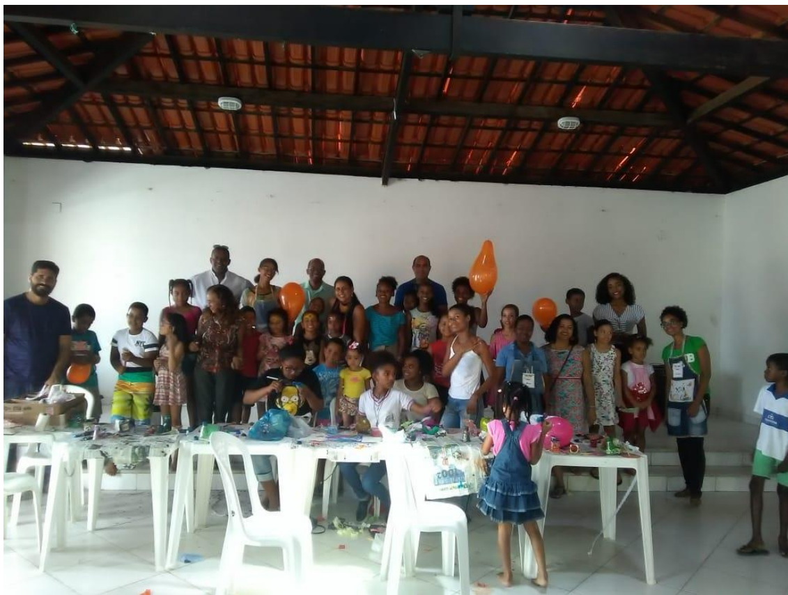
Integrantes da Mãe Rainha, da Brinquedoteca do DEDC I, PROEX e crianças da comunidade.