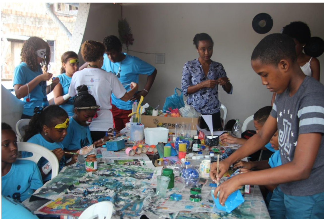
Crianças do Projeto Biuí/ODEART aprendem a confeccionar brinquedos com material reciclado