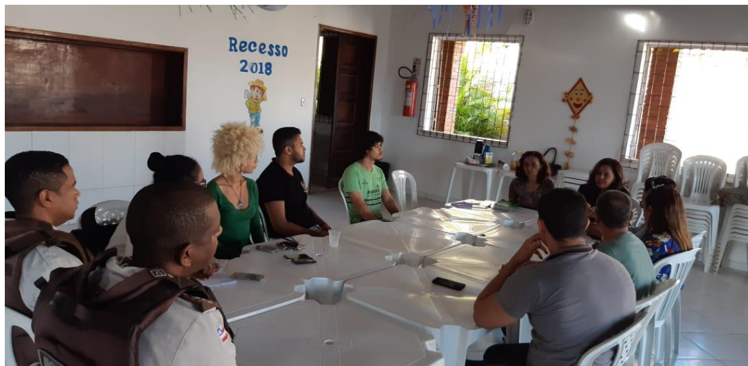
Reunião no bairro Alto de Coutos com integrantes da Mãe Rainha, PROEX e Polícia Militar.