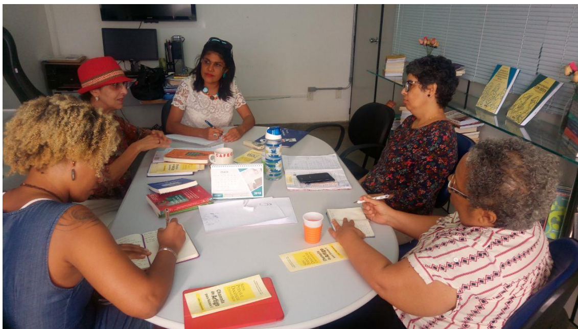
Reunião de articulação das Séries com EDUNEB, PROGRAD, PRAES, PROAF e PROEX

acolhidos trabalhos que versaram sobre a temática “Ecologia de Saberes na Universidade” e foram previamente avaliados por três pareceristas ad hoc com titulação de Doutorado.