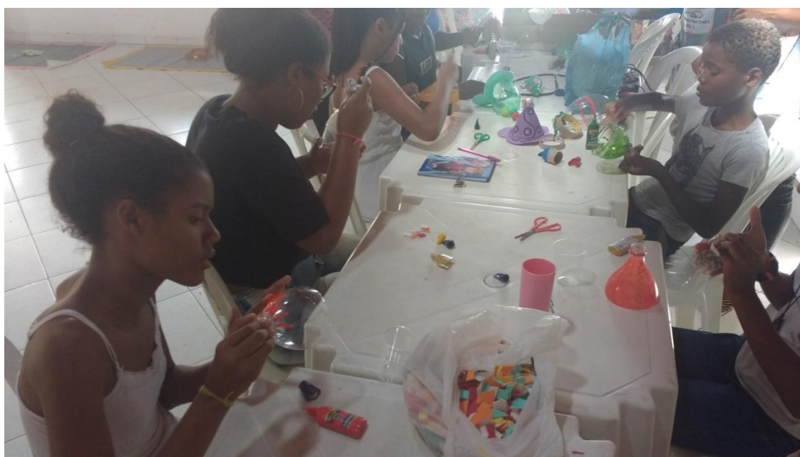
Crianças de Alto de Coutos aprendem a confeccionar brinquedos com material reciclado

Com o intuito de contribuir com o desenvolvimento intelectual do público, a partir de atividades lúdicas e que favoreçam o despertar para o respeito ao meio ambiente, a PROEX em parceria com a Brinquedoteca do Departamento de Educação do Campus I da UNEB, realizou duas oficinais de brinquedos recicláveis com crianças ligadas às Obras Sociais Mãe Rainha (Alto de Coutos) e à ODEART (Engomadeira), nos dias 04 e 06 de Setembro de 2018, respectivamente.