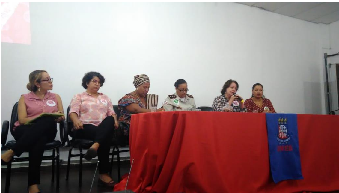
Participantes da roda de conversa