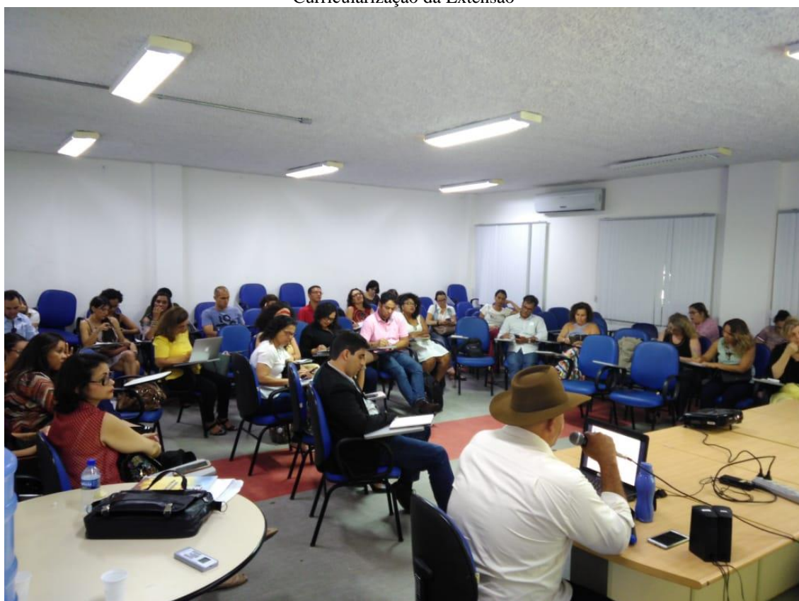
Mostra de Projetos de Extensão – Grupo de Trabalho 2