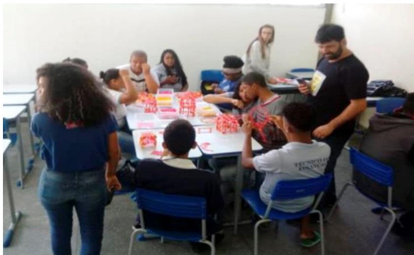
Curso de Robótica Educacional