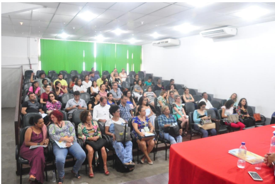
Público - Roda de Conversa Curricularização da Extensão