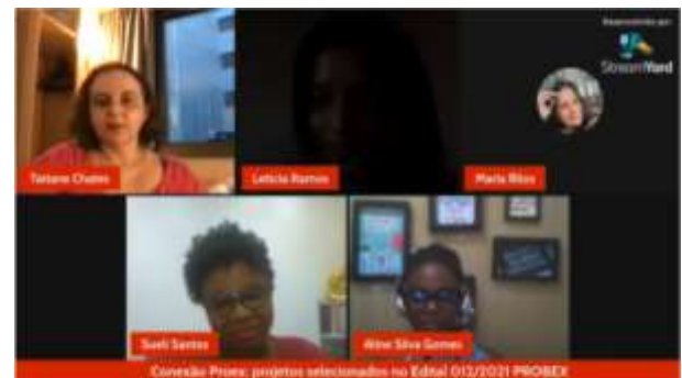
Conselho PROEX: projetos selecionados no Edital 013/2021 PROEX. 19 de outubro