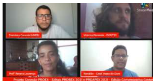
Conexão PROEX: projetos selecionados nos Editais PROAPEX e PROBEX. 24 de novembro