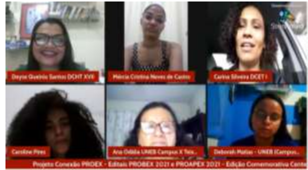
Conexão PROEX: projetos selecionados nos Editais PROAPEX e PROBEX. 1º de dezembro