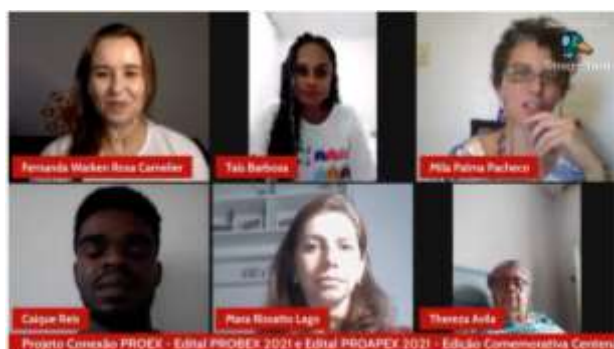
Conexão PROEX: projetos selecionados nos Editais PROAPEX e PROBEX. 23 de novembro