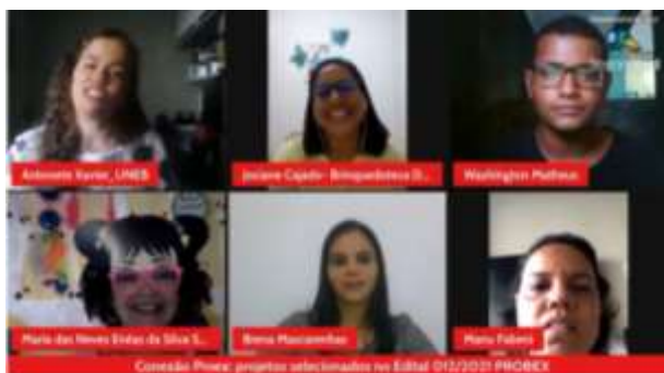
Conexão PROEX: projetos selecionados no Edital 012/2021 PROBEX. 09 de novembro

XIII); Monitora Bolsista do projeto. Disponível em https://www.youtube.com/watch?v=wMnPKpGfXqc&t=717s