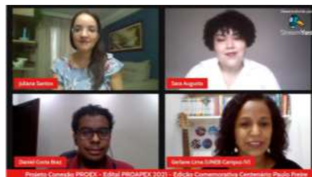
Projeto Conexão PROEX: projetos selecionados no Edital 042/2021 PROAPEX. 04 de novembro