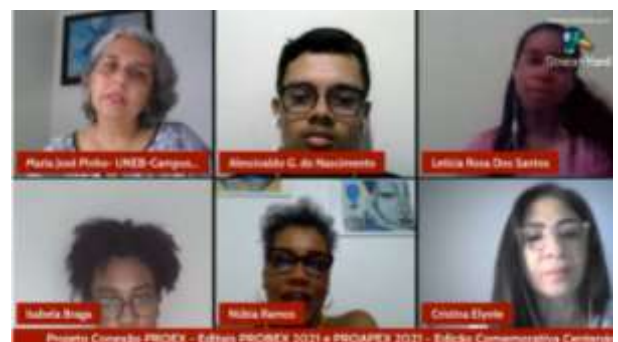
Conexão PROEX: projetos selecionados nos Editais PROAPEX e PROBEX. 09 de dezembro