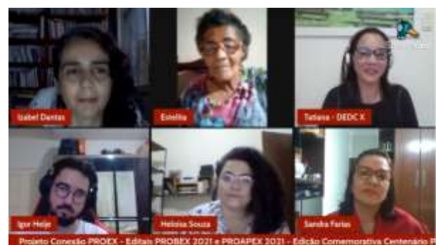
Conexão PROEX: projetos selecionados nos Editais PROAPEX e PROBEX. 14 de dezembro

https://www.youtube.com/watch?v=40GAIOLLYdQ&t=81s