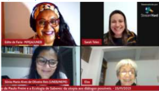
Conexão PROEX: O Legado de Paulo Freire e a Ecologia de Saberes: da utopia aos diálogos possíveis. 25/11/2021

https://www.youtube.com/watch?v=YAefYo89ml8&t=1522s