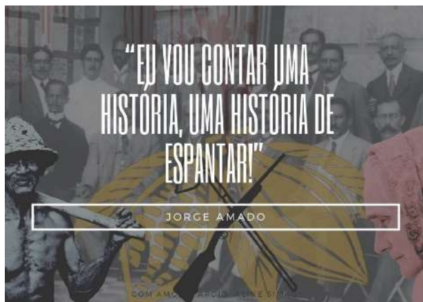
Imagem 1: Capa da exposição- autoria: Thaís Vinhas Fernandez. Imagem 2: Card exposição- autoria: Matheus Henrique Gonçalves da Costa.

DCHT XX – BRUMADO | Projeto Multiportas: Cultura de paz e MASC's - É com muito prazer que o Programa Multiportas: Cultura de paz e MASC's convida todos(as)(es) para o 1º Encontro de