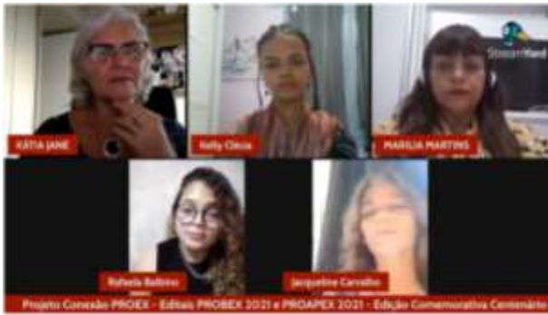
Conexão PROEX: projetos selecionados nos Editais PROAPEX e PROBEX. 30 de novembro