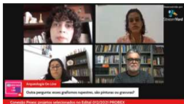
Conexão PROEX: projetos selecionados no Edital 012/2021 PROBEX. 03 de novembro