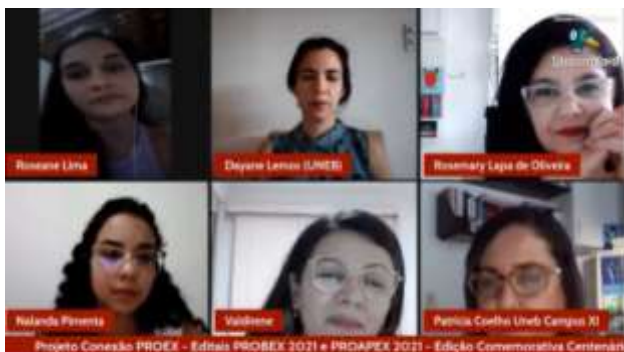
Conexão PROEX: projetos selecionados nos Editais PROAPEX e PROBEX. 13 de dezembro

https://www.youtube.com/watch?v=Fpz5xc1IIMq&t=3s