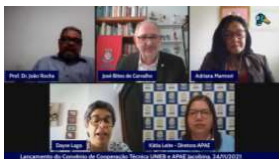
Lançamento Cooperação Técnica UNEB e APAE Jacobina