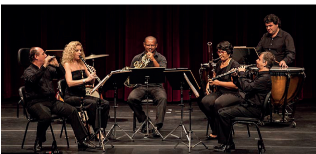
Camerata Opus Lúmen.

Projeto Ancestralidade no Campus | Promovido pela GACC, no dia 30 de setembro, às 9h30, será realizada na Praça Verde do Campus I a abertura do projeto, que tem como objetivo divulgar a produção artístico-cultural das culturas ancestrais, bem como promover o acesso da comunidade universitária e do entorno aos bens culturais ancestrais. Para tanto, serão realizadas apresentações musicais, teatrais e literárias (oral ou escrita), de diversas culturas ancestrais. Neste encontro teremos duas mesas temáticas com o tema central: "Panorama científico e artístico-cultural das comunidades ancestrais". O encontro contará ainda com roda de capoeira, performance poética e exposição de artesanato.