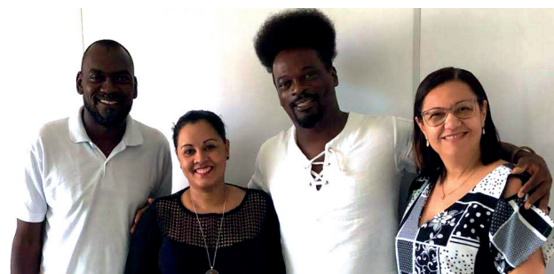
Estarão abertas as inscrições para o curso de extensão em língua Kimbundu.