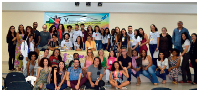
Encerramento, 30 de agosto.