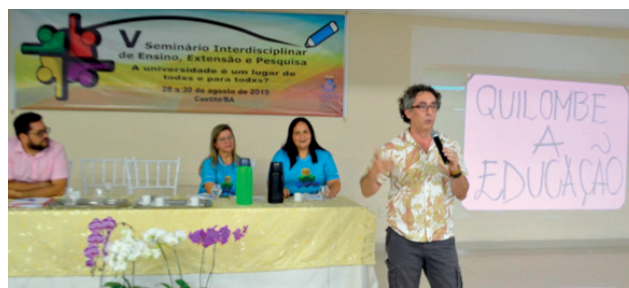
Mesa-redonda: Interloções entre Universidade e Educação Básica, 30 de agosto.